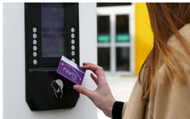
Carte KiWhi Pass® accédant à une borne de recharge pour VE